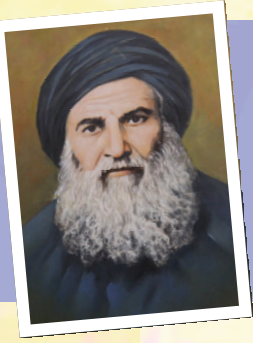
הרב יוסף בוכריץ זצוק"ל - תמונה מתוך בית-הכנסת