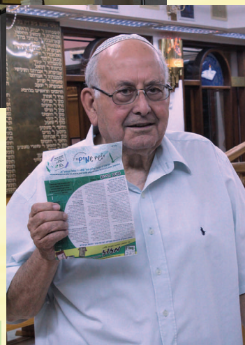
שיעורי תורה בבית-הכנסת:

רוצים לקרוא וללמוד עוד על הרב בוכריץ? נכנסו לאתר www.shtaygen.co.il