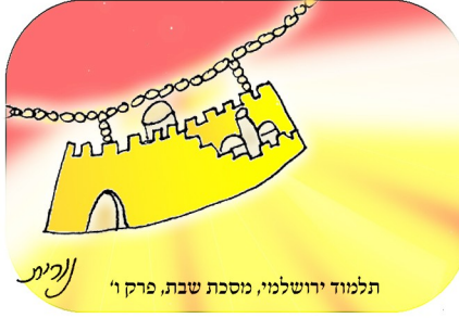
תלמוד ירושלמי, נוסכת שבת, פרק ו' א"ת

מועשה בר' עקיבא שעשה לאישתו עיר של זהב (תכשיטי יקר)