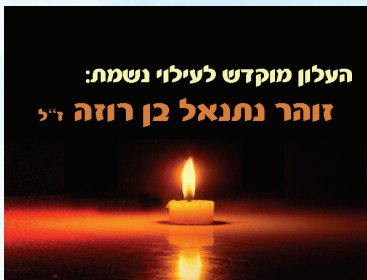
העלון מוקדש לעילוי נשמות: זוהר נתנאל בן רוזה ז"ל

פרשת 'תרומה'- גיליון מס' 114 ב' אדר התשע"ב. העלון מופץ ביבנה, בית גמליאל, גבעת וושינגטון, קיבוץ יבנה, בן זכאי, ניר גלים, גן יבנה וכאי-מיילים ניתן לראות את כל הגיליונות באתר www.tipot.co.il חפשו אותנו בפייסבוק