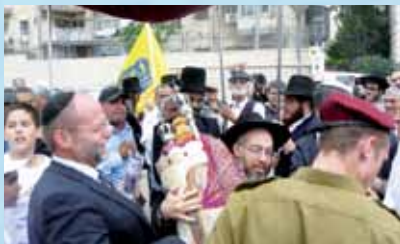
הרב מנשה בן פורת רוקד לכבודה של תורה

של בית החולים, וחזר לייעודו המקורי - מקום לתורה ותפילה עבור עובדי "רשות השידור". בערב חג השבועות, חגגו עובדי הרשות, חיילי יחידת דודבן, ילדי בית הספר חורב, יחד עם הרבנים הגאונים שליט"א, ובראשם הרב הגאון משה שלמה עמאר שליט"א, את חנוכת בית הכנסת, והכנסת ספר התורה למקום. היה זה מחזה מרגין לב של אחדות ישראל: חרדים, דתיים לאומיים, חילונים, חסידים וחיילים, רקדו חבוקים לכבודה של תורה. כל המחיצות נפלו באחת לנוכח ספר-תורה. נקווה, שהמקום ישפיע השפעה חיובית על שידורי רשות השידור.