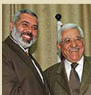
"אבו מאזן ואיסעיל הנבייה"

בעת כתיבת שורות אלו התפרסם כי ארגון הפת"ח וארגון החמאס הגיעו להסכם פיוס היסטורי בסיוע "מצרים החדשה". "פי נועצו לב יחדו, עליף ברית יכרתו". על פניו נראה כי ההסכם הינו לרעת ישראל, ומכאן הפחד והחרדה לתושבי ישראל מהברית הנ"ל. אמנם, בואו ונקשיב לנבואת ההרגעה של המקובל האלהי רבי משה קורדובירו זצ"ל (המכונה הרמ"ק), בקשר למה שיקרה באחרית הימים: "ויתאספו כל העמים, ויעשו עצת שלום ביניהם , ויתהפכו ישראל להשמיד, מפני שהקימו להם מלכות, ותהא עת צרה ליעקב, אומנם לא יבוא לשבר [משבר], אלא ממנה יושע". (אור יקר עמוד 122). מלבד מה שמדהים בדבריו, שלמרות שהרב חי לפני בערך כ-500 שנה, כבר חזה ברוח קודשו את הקמת "מדינת ישראל", וכמו שכותב בלשונו "מפני שהקימו להם מלכות", מלבד זאת יש בדבריו מסר מרגיע עבורנו: ומה אם בשעה שכל העמים יעשו שלום ביניהם ויתאספו נגדנו, הדבר יביא רק לטובתנו (כי זה דווקא יביא למפלתם, ראה בהמשך), ק"ו בהתחלת ההתאספות ועשיית השלום ביניהם שאין לנו לחשוש מכך כלל.