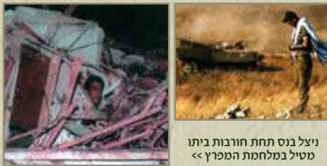
ניצל בס תחת חורבות ביתו מטיל במלחמת המפרץ >>

שהיה צריך להגיע אליהם מכיוון ירדן... ואכן, במערב העיר היו טנקים רבים של האויב (ערביי שכם), הם לא הפעילו אותם כנגדנו אך ורק משום שהם סברו שאנחנו מכווניהם, הם עמדו על טעותם מאוחר מאד".