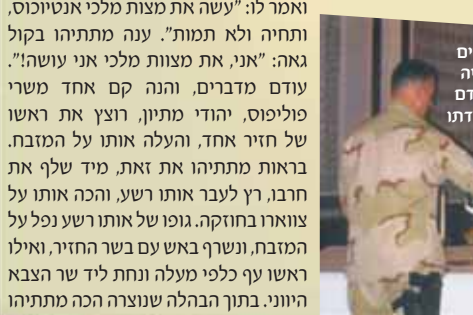
חיילים אמריקאים מדליקים תנוכה בארמונו של סאדם חוסיין סמוך ללכידתו

היהודים הנאמנים לה' ולתורתו מסרו נפשם למיתה על שמירת השבת והכשרות וכו'. יראה ה' הבינו שהתורה והיהדות נתונים בסכנת קיום, והם החליטו לצאת למלחמה גלויה מול הצורר. ההתקוממות הגלויה התחילה בעיר "מודיעין". משהגיעה השמועה ל"פוליפוס" הוא עלה עם צבאו למודיעין, הקים בה פסל, וציוה על כל התושבים להקריבו לקרבן.