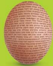
עיצוב והפקת ספרים