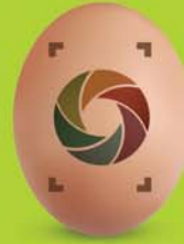
3 לואס סאלס אאנוני