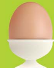
אבריכות ועיצוב פנים

כל הדרכים להשתלב בעולם העיצוב, התקשורת החזותית והמדיה עכשיו במכללת בית פרוג - רק תבחרו!