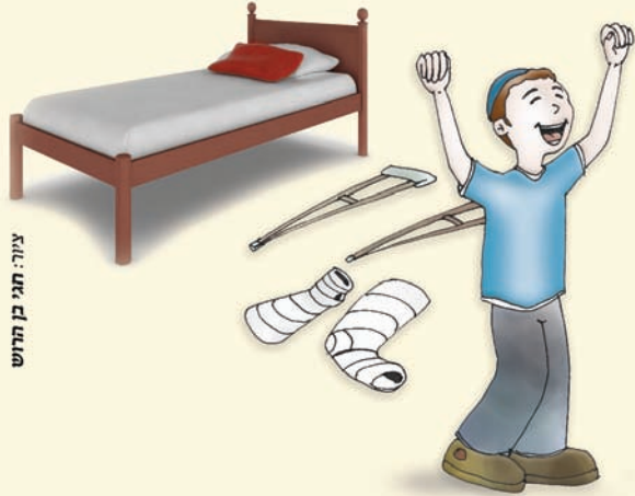
עזרה: תני מן מרש

"בני האדם יכולים לרפא את עצמם מכל מחלה, כאשר הוא חושב מחשבות חיוביות בהן הוא רואה את עצמו כשלם ובריא לחלוטין, והוא מאמין באמונה חזקה בכך, ומרגיש בקרבו שמחה פנימית אמיתית, אזי פועלת הרוח על הגוף ומרפא אותו, כנגד כל 'חוקי הטבע'..."