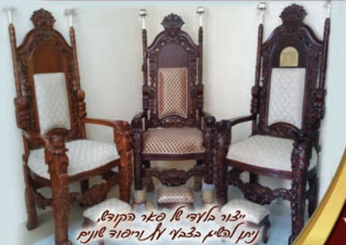
יבנה בארץ של פאר הקופל, יתן אפילו בביתו מן מוסד לזקנים