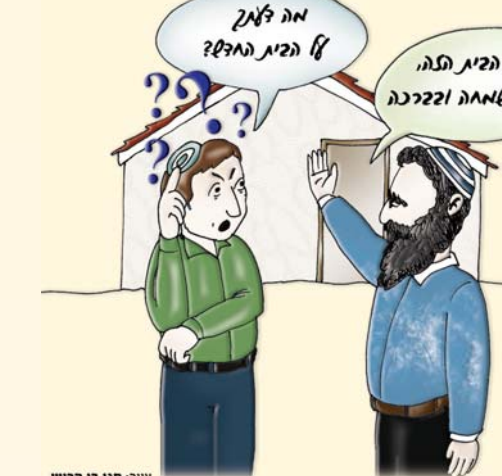
ציור: חגי בן הרש