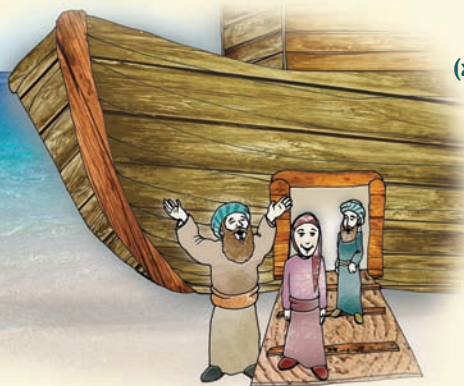
ציור: חגי בן הרוש

(מתוך הספר: "פי צדיק" מפי הרב ניר בן ארצי שליט"א)