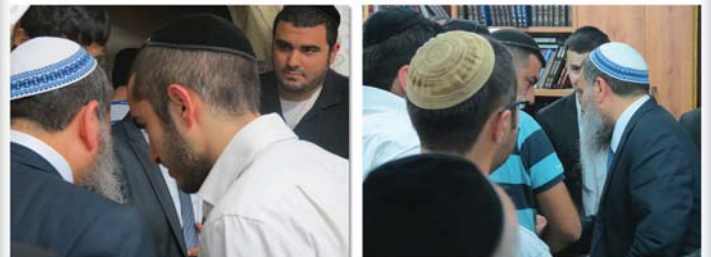
הכנס שהתקיים בכוכב-יעקב באולם השמחות בכוכב-יעקב, ביום שני י"ג חשוון תשע"ג (29.10)