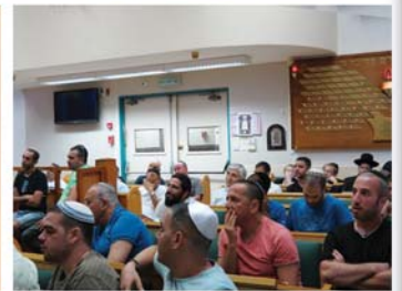
הכנס שהתקיים בראש-העין בביה"כ "נצח ישראל", רח' המוביל, ביום ראשון ז' תשרי תשע"ג (23/9)