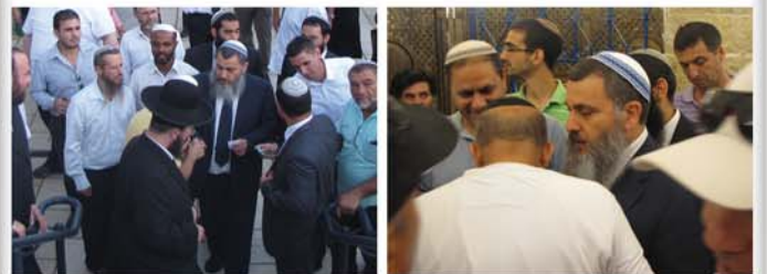
נסיעה לקברי צדיקים בצפון ביום רביעי י"א אלול תשע"ב (29.8)