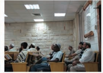
הכנס שהתקיים באור יהודה בביה"כ "נווה סביון", רח' צאלון 24 ביום רביעי ו' אב תשע"ב (25.7)