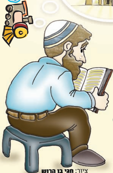
ציור: חגי בן הרוש