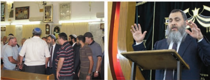
הכנס שהתקיים בחיפה בביה"כ "אביר יעקב", רח' ערד 7 ביום שני כ"ו תמוז תשע"ב (16.7)