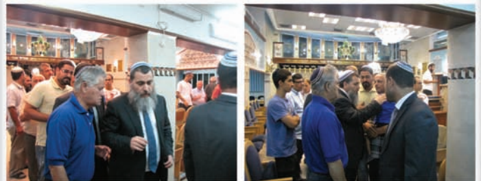
הכנס שהתקיים בקרית ביאליק בביה"כ "עץ חיים", רח' סמטת אשר ביום רביעי כ"א תמוז תשע"ב (11.7)

לצפייה בכנסים ניתן להיכנס לאתר www.tairneri.co.il