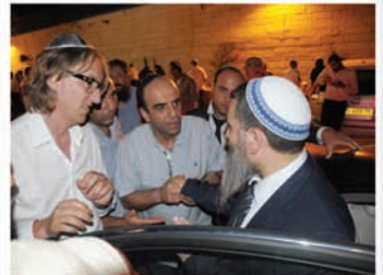
הכנס שהתקיים בערד בביה"כ "בית רחמים" ביום רביעי ל' בסיוון תשע"ב (20.6)