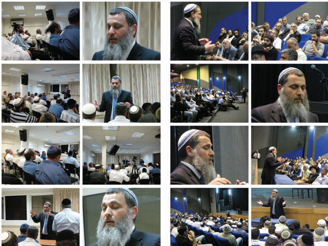
הכנס שהתקיים ביהוד במרכז הרוחני, רח' יהודה הלוי 34 ביום רביעי י' אייר תשע"ב (2.5)