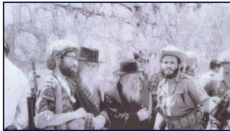
הרב ישראל אריאל (משמאל) מגיע עם הרבנים הראשונים לכותל

לאחר מכן חזרתי למפקדה של מוטה גור, הוא שלח את אחד המפקדים שיאמר לי: "אתה עכשיו ניגש